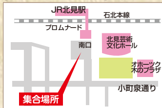
【JR北見駅南口 ご案内図】