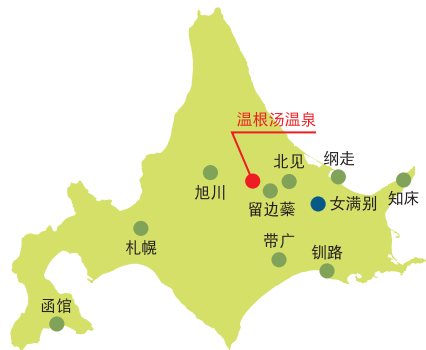
●与温根汤温泉间的距离和所需时间